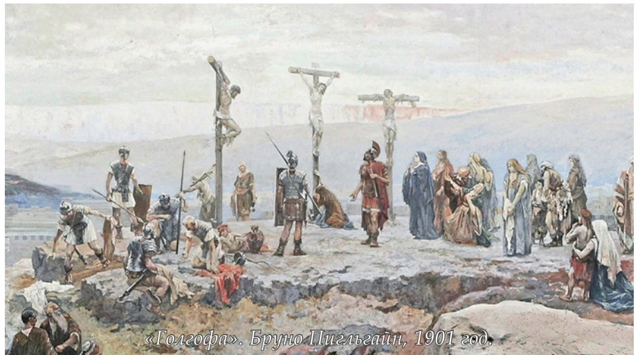
«Голгофа». Бруно Пигльгайн, 1901 год.

В эти дни по-настоящему ужасаешься своей жизни, понимаешь, что обычные наши суетливые будни, с их редким воспоминанием о Господе, безбожны по своей сути. Похоть плоти, похоть очей, и гордость житейская (Ин. 2,16) наполняют наш жизненный кубок до самого края. Потому-то и пришлось идти на Крест Божественному Страдальцу, что миллиарды людей жили, живут, и будут жить безбожно. И ты ничего не сможешь изменить,