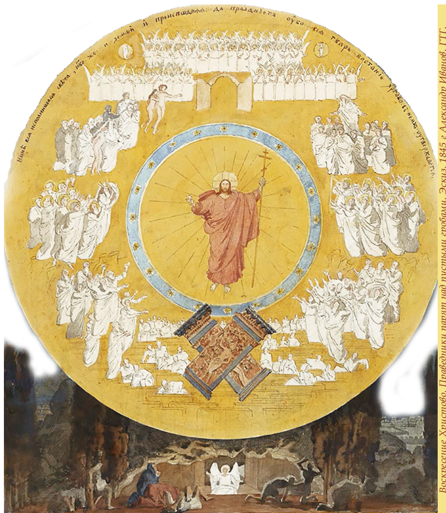
Воскресение Христово. Правдопикни парят над пустыми гробами. Эскиз. 1845 г. Александр Иванов. ГТГ.

Свт. Амвросий Медиоланский. Переложение М. Линькова