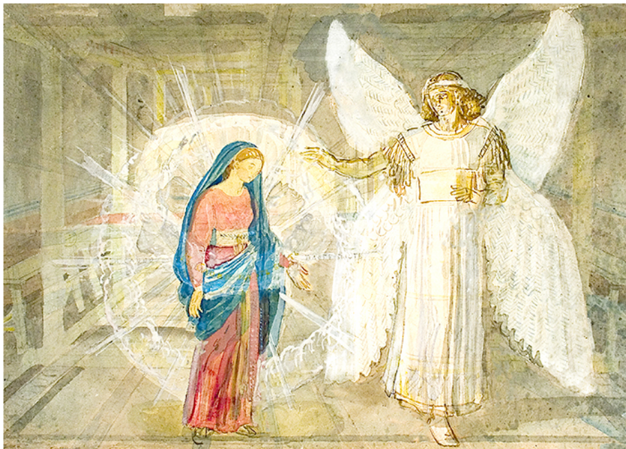
Благовещение. Эскиз. Александр Иванов, 1849-1858 гг. Государственная Третьяковская галерея. Москва. Эпизод в Библии: Лк 1:28-38.

Это состояние всецелого посвящения себя Богу. ►