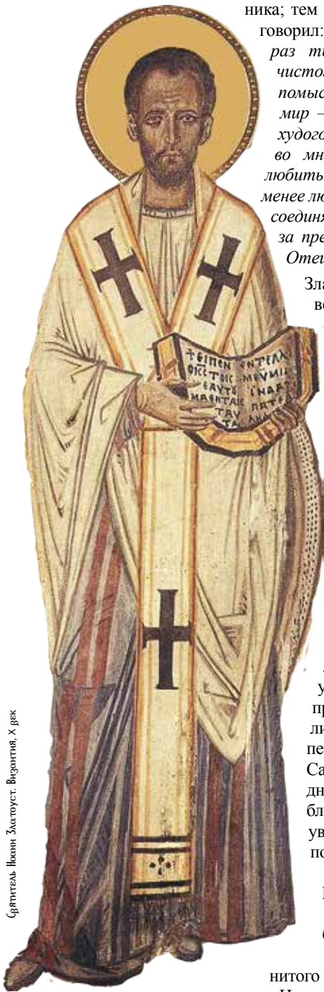
Святитель Иоанн Златоуст. Византия, X век

Пастырь бичевал грех, а не грешника; тем же, кто уязвлялся, он говорил: «Хоть бы шестьсот раз ты бранил меня, от чистого сердца, чистым помыслом говорю тебе: мир — и не могу сказать худого, ибо любовь отца во мне... Тем более буду любить вас, чем более любя, менее любим буду. Ибо многое соединяет нас: одна Трапеза предложена, один у нас Отец».