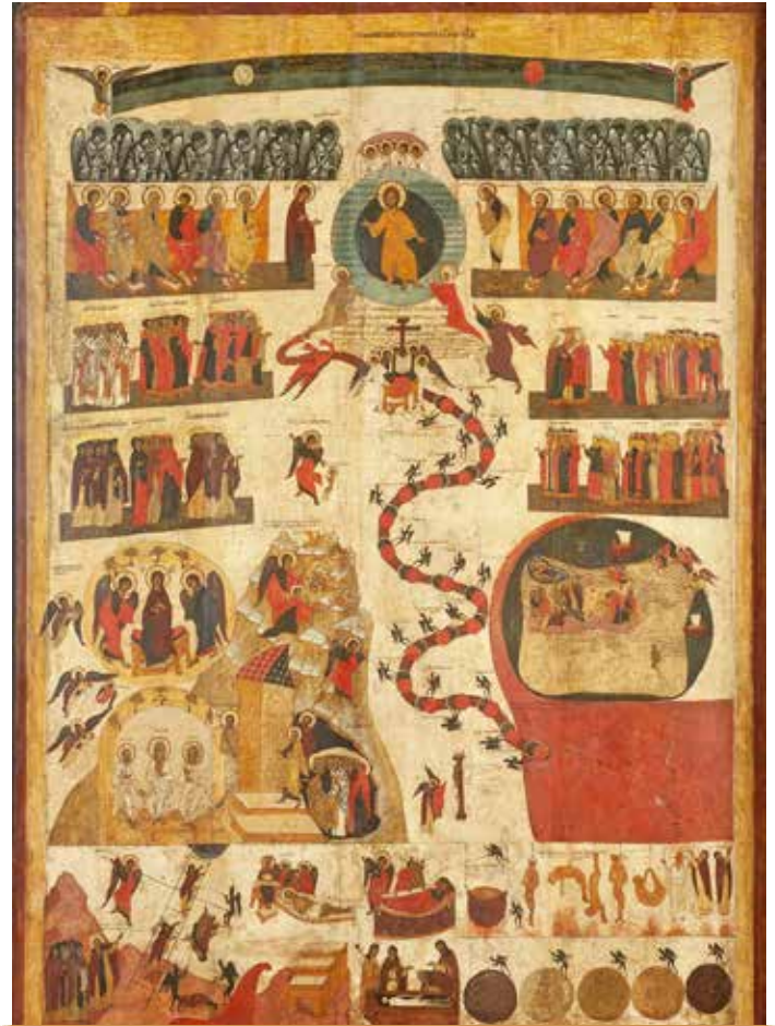
Страшный Суд. Россия. Новгород Великий, XVI в. Санкт-Петербург. Воскресинский Новодивичий монастырь. Казанская церковь

плотской страстностью, однако сердце ваше устояло: вы не ходили в «похоти сердца» (Рим. 1:24), вы не глядели на то, что делали другие, что делают все, но горели, как яркий и чистый светоч, постоянным огнем любви к Богу, ко всему истинному и прекрасному.